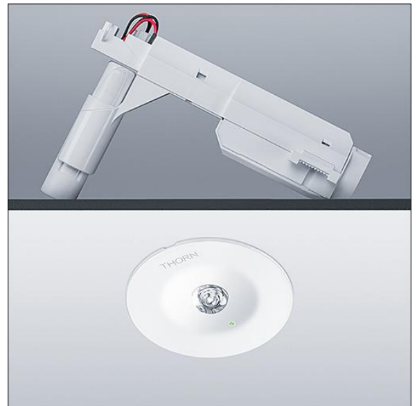
TLG_VSTR_F_MR CR E3D_ANT_WH.jpg