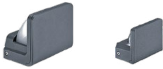
RAZE Archi Large