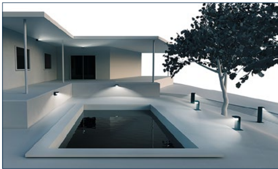
ÉCLAIRAGE RASANT DES AUVENTS, DES CHEMINS PIÉTONNIERS ET DES ABORDS DES BÂTIMENTS