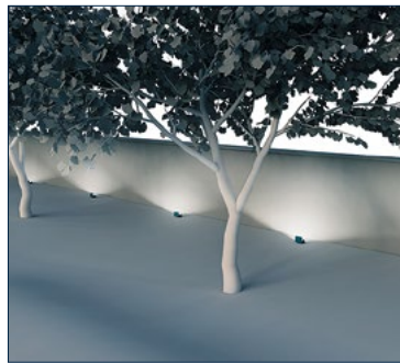
ÉCLAIRAGE RASANT DES FAÇADES ET DES SURFACES VERTICALES