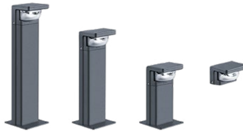
Borne RAZE ht. 90 cm